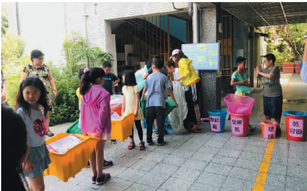
每周五的垃圾回收日,大佳国民小学都进行垃圾分类回收

5月28日,参与此次环保之旅的学员们历经八九个小时飞行后落地台北市,在经历开营破冰仪式后,学员们很快熟络了起来,开始了对台北这座城市的探访。